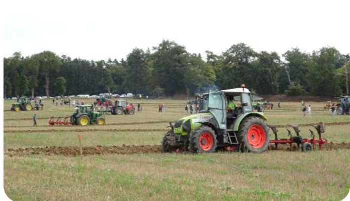
Le 30 septembre dernier, le Comice agricole a accueilli de nombreux visiteurs